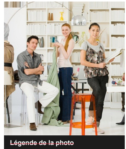
Légende de la photo

La plupart des publications réussies se composent de divers types de contenu afin de satisfaire tous les goûts. Pensez à placer le contenu le plus sérieux sur la première page et le contenu plus léger à l'intérieur.