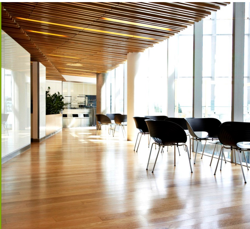
Légende de la photo

Par exemple, si votre article principal parle de plans de construction, utilisez l'encadré pour raconter l'histoire du terrain ou de votre découverte de la propriété.