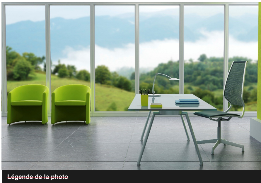
Légende de la photo